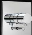
GS 74580 U1