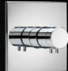
GS 74560 U1